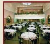
Laprida 1339 * 4826-3151 Laprida 1469 / Charcas 2952

Lo invitamos a conocer nuestra propuesta, ideas y compromiso con el desarrollo de proyectos creativos. En alSur encontrará todos los servicios aplicados a la imagen y comunicación de su empresa.