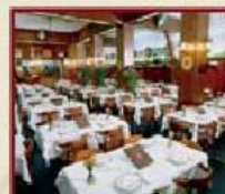
Lavalle 735 * 4393-5849 / 4394-7060