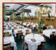
Lavalle 954 * 4322-1599

e-mail: lavalle735@sion.com www.elpalacio-papafrita.com.ar