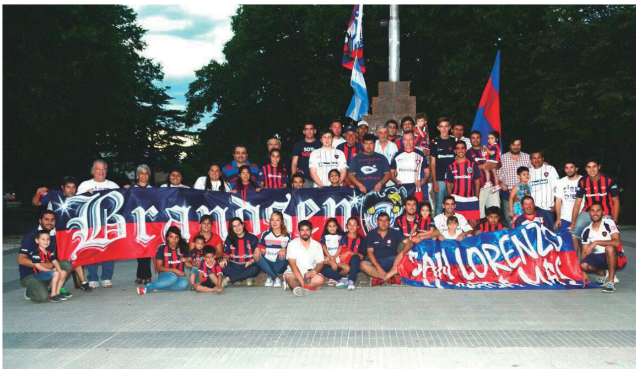
LA PEÑA REUNIDA EN SU CIUDAD.