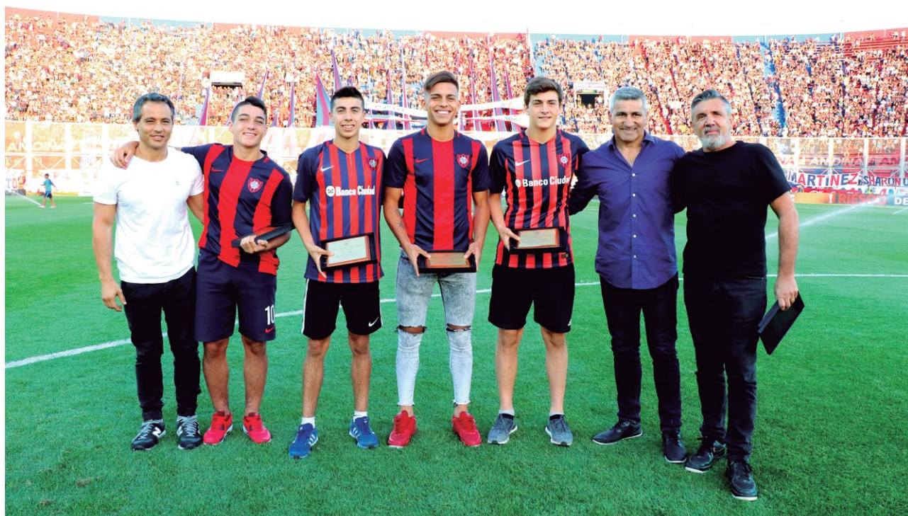
LOS CAMPEONES RECIBIERON UN RECONOCIMIENTO EN EL PARTIDO ANTE ARGENTINOS.

L os juveniles de la Selección Nacional Argentina Sub 15 alimentaron la resurrección del fútbol argentino. No sólo por la conquista del primer Torneo Sudamericano de la historia sino también por el proyecto formativo que pusieron en marcha Diego Placente y Pablo Aimar.