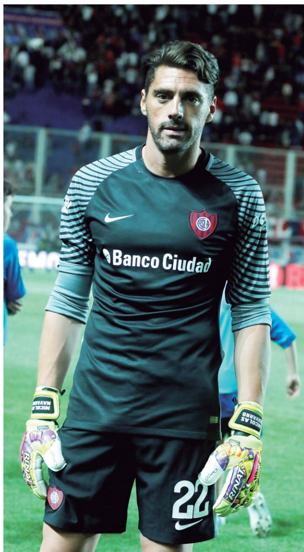
EL DUEÑO DEL ARCO.