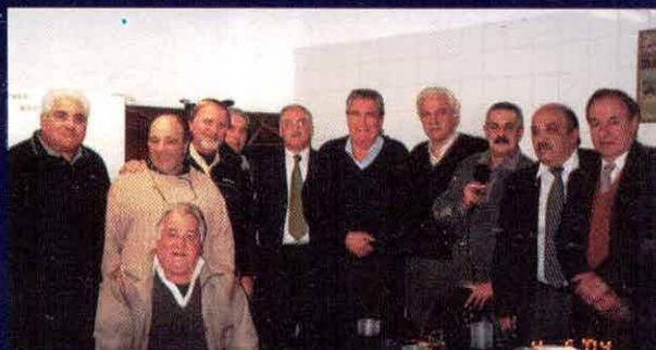
El Café del Ciclón (foto izquierda) y la Hora del Ciclón (foto derecha) transmitieron sus programas desde Unidad Azulgrana el 25 de Mayo y el 4 de Junio pasado