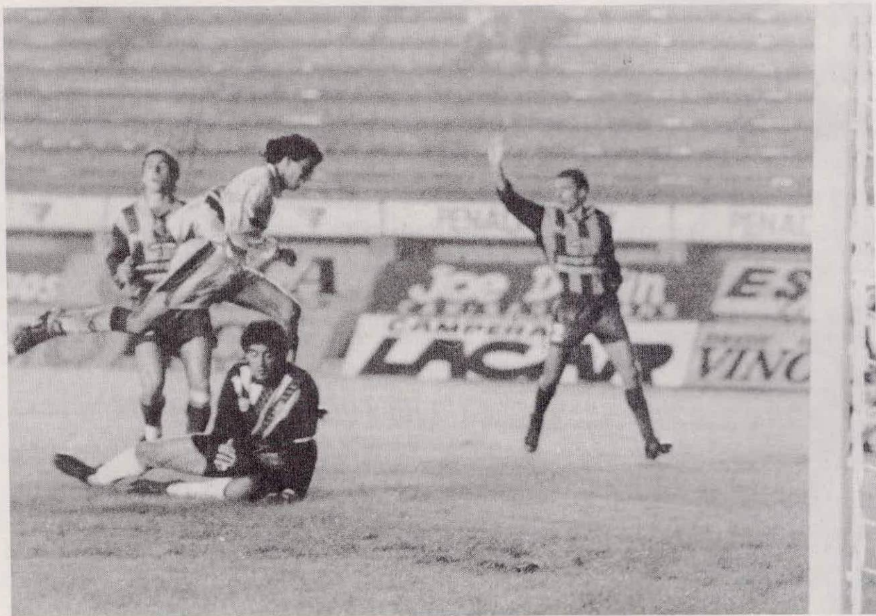
Monserrat a la carrera pone el 1 a 0. Buen desborde del "Pampa" y excelente definición del "Diablo".

Los 22 jugadores salieron a la cancha con los dientes apretados. Los primeros 15 minutos mostraron la lucha por el mediocampo; San Lorenzo y Central se trenzaron en una franja de 40 metros, olvidándose de las áreas. A pesar de ello, San Lorenzo parecía algo más interesado en buscar los caminos al área rival; esa fue la sensación hasta que