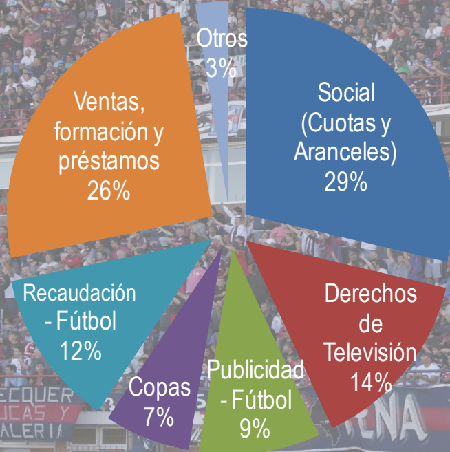
Composición de Recursos