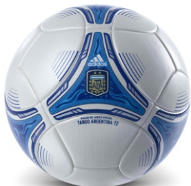
Adidas Tango Argentina 12.