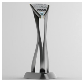
Creado por Blas Herrera.