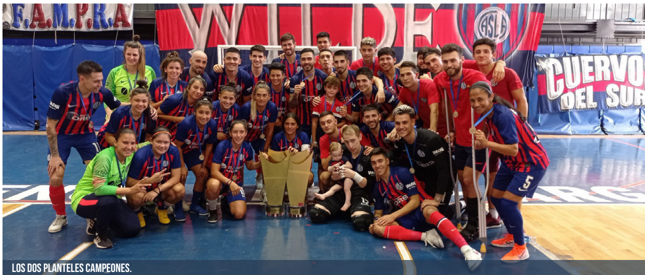
LOS DOS PLANTELES CAMPEONES.

Los equipos masculinos y femeninos de futsal se consagraron campeones de la Supercopa en la misma jornada, ambos en el Polideportivo Roberto Pando, y terminaron celebrando todos juntos en el corazón de Boedo. ¡Fiesta!