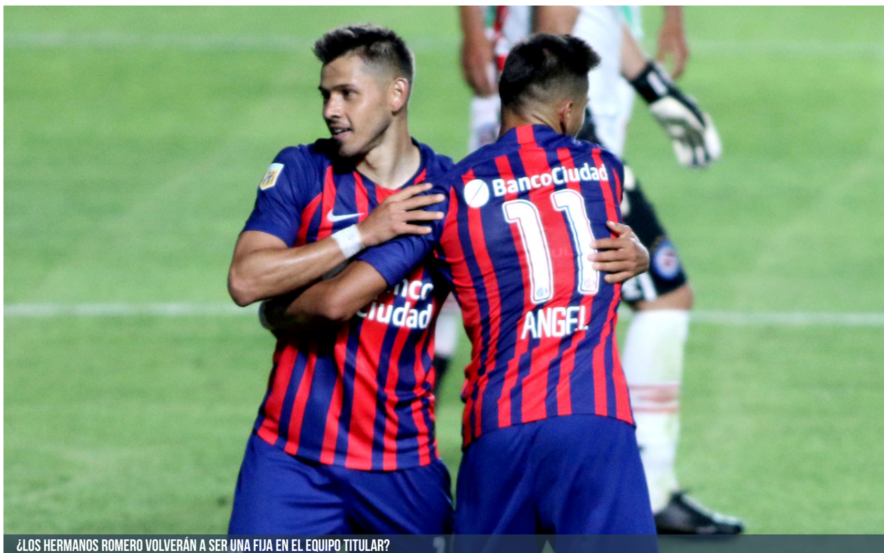
¿LOS HERMANOS ROMERO VOLVERÁN A SER UNA FIJA EN EL EQUIPO TITULAR?