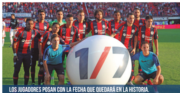
LOS JUGADORES POSAN CON LA FECHA QUE QUEDARÁ EN LA HISTORIA.

Los más de 8.000 metros cuadrados que le siguen perteneciendo a la empresa hoy pareciera que quedarán sin uso. El CASLA tiene la prioridad para sentarse a negociar su compra, pero hasta ahora no hay una decisión oficial sobre qué harán en ese sector.