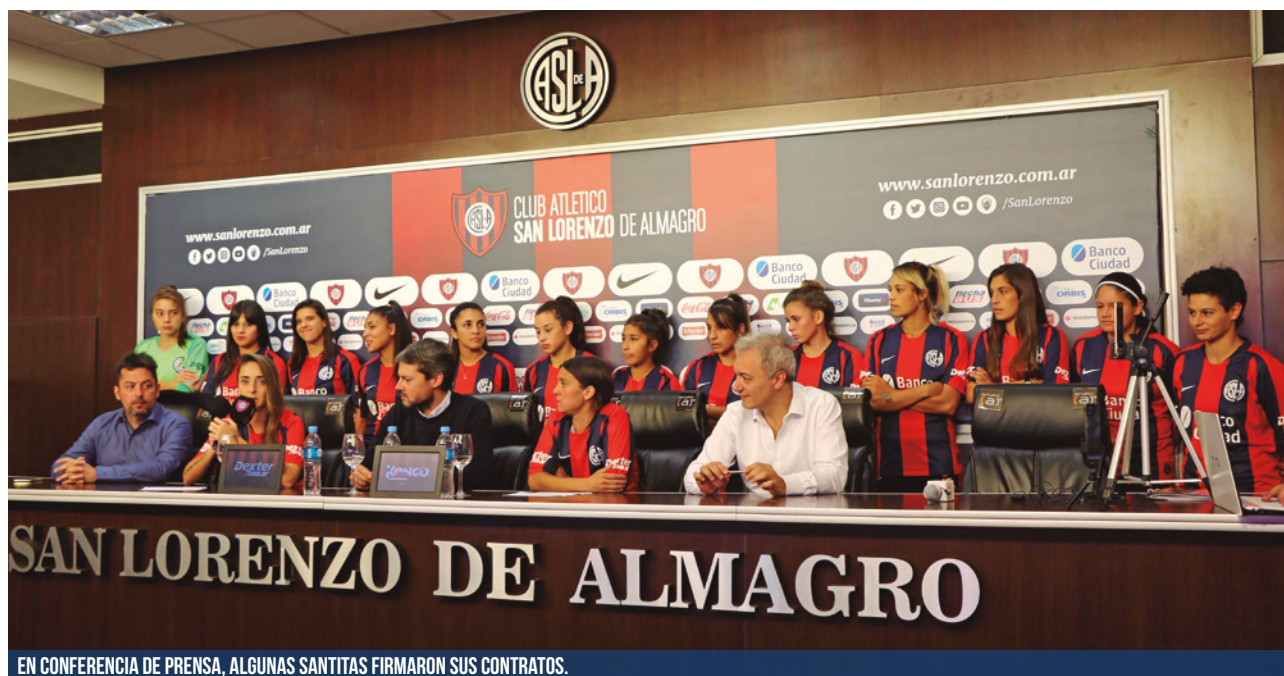
EN CONFERENCIA DE PRENSA, ALGUNAS SANTITAS FIRMARON SUS CONTRATOS.

San Lorenzo es el primer club del país en haber firmado los contratos profesionales de su plantel de fútbol femenino y apuesta fuerte por una disciplina que no para de crecer.