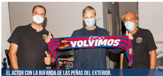
EL ACTOR CON LA BUFANDA DE LAS PEÑAS DEL EXTERIOR.

En Valencia y luego de presentar Falling , su última película y en la que debutó como director, Viggo Mortensen fue sorprendido por la peña Cuervo Che de Valencia que lo recibió a puro amor azulgrana.