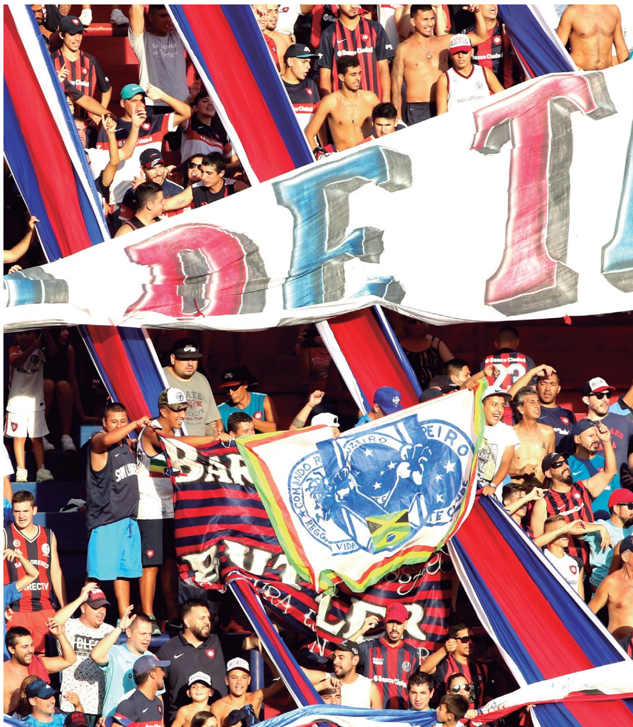
LA BANDERA DE "LA MAFIA AZUL" EN LA TRIBUNA AZULGRANA

pasión". La "Mafia Azul" se caracteriza por estar presente en todos los estadios tanto de local como de visitante... En todos lados. Brasil es muy grande y tiene equipos fuertes en diferentes regiones, eso complica un poco las cosas, pero de todas maneras le buscamos la vuelta para poder estar.