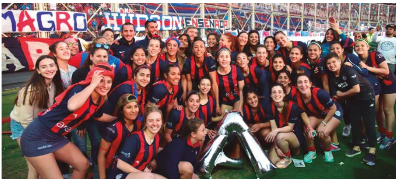
LAS CUERVAS FESTEJARON EN LA PREVIA AL PARTIDO ENTRE SAN LORENZO Y BOCA.

Luego del triunfo ante Mitre, el hockey de San Lorenzo consiguió lo que tanto venía anhelando: el ascenso a la Primera División. Un logro histórico para la institución, que estará compitiendo por primera vez en la máxima categoría de nuestro país.