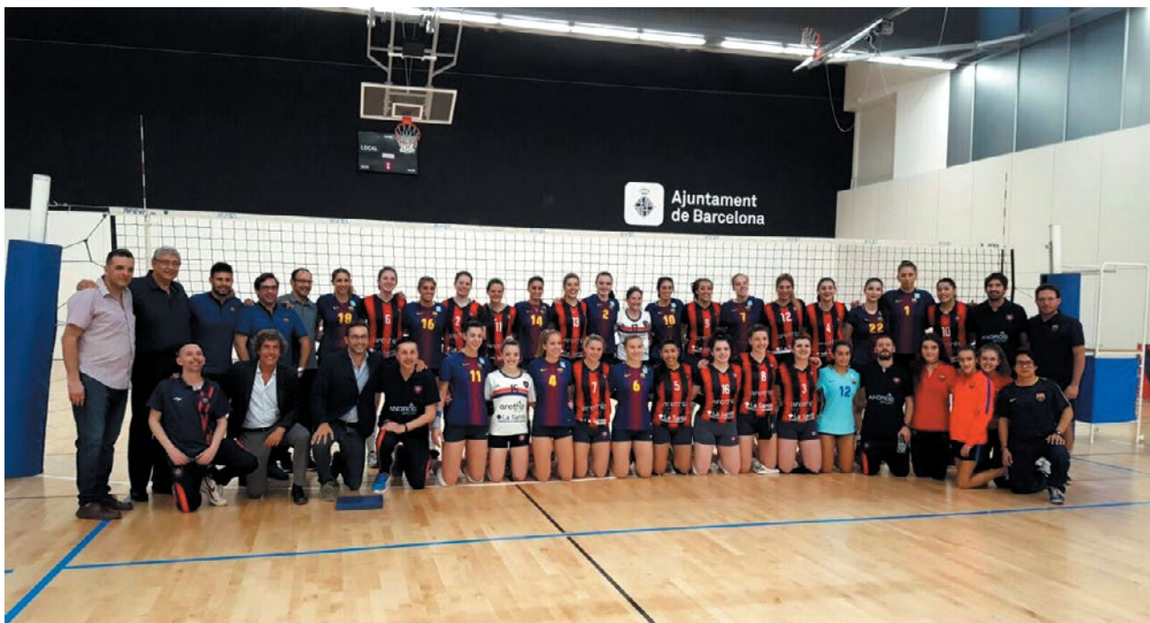
LA DELEGACIÓN COMPLETA QUE VIAJÓ A ESPAÑA.

Un nuevo deporte de San Lorenzo que hace historia tras pisar tierras europeas. Las Matadoras viajaron a España para disputar dos torneos amistosos.