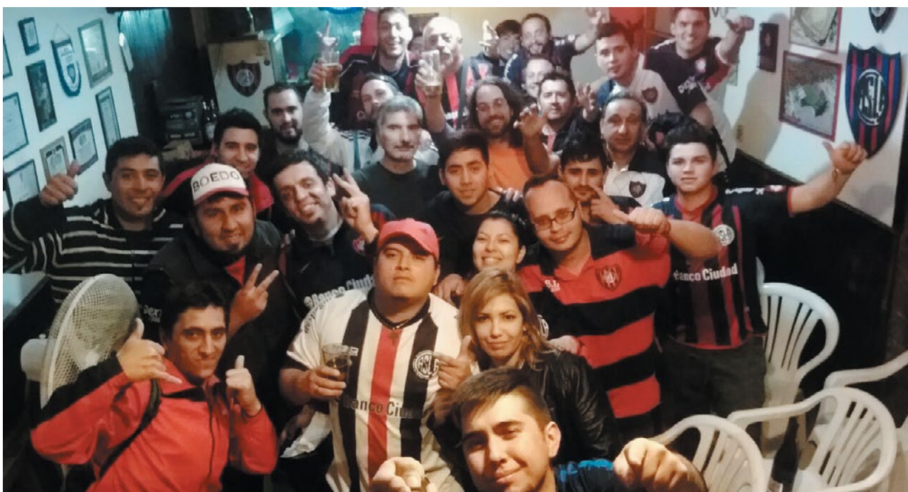
LOS CUERVOS REUNIDOS EN SU SEDE MIRANDO AL CICLÓN.