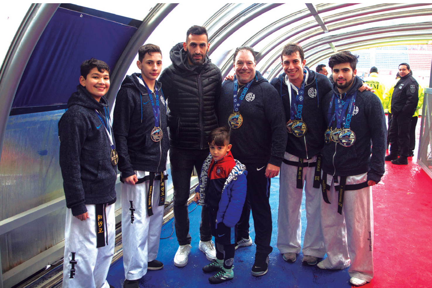
CON EL CÓNDOR TORRICO EN EL TÚNEL DEL PEDRO BIDEGAIN.

particular, pero esta vez el lugar que se nos dio en medios importantes hizo que se hable de la disciplina.