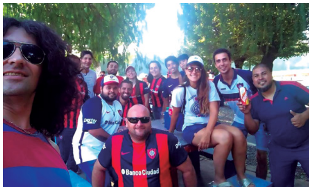
ENCUENTRO DE ALGUNOS REFERENTES DE PEÑAS DEL INTERIOR.

mos constituidos como Peña Oficial y no recibíamos el cronograma de actividades del Departamento de Peñas.