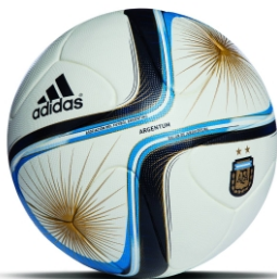
Adidas Argentum 2015