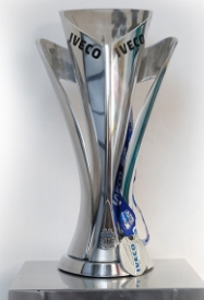
El trofeo de Iveco.