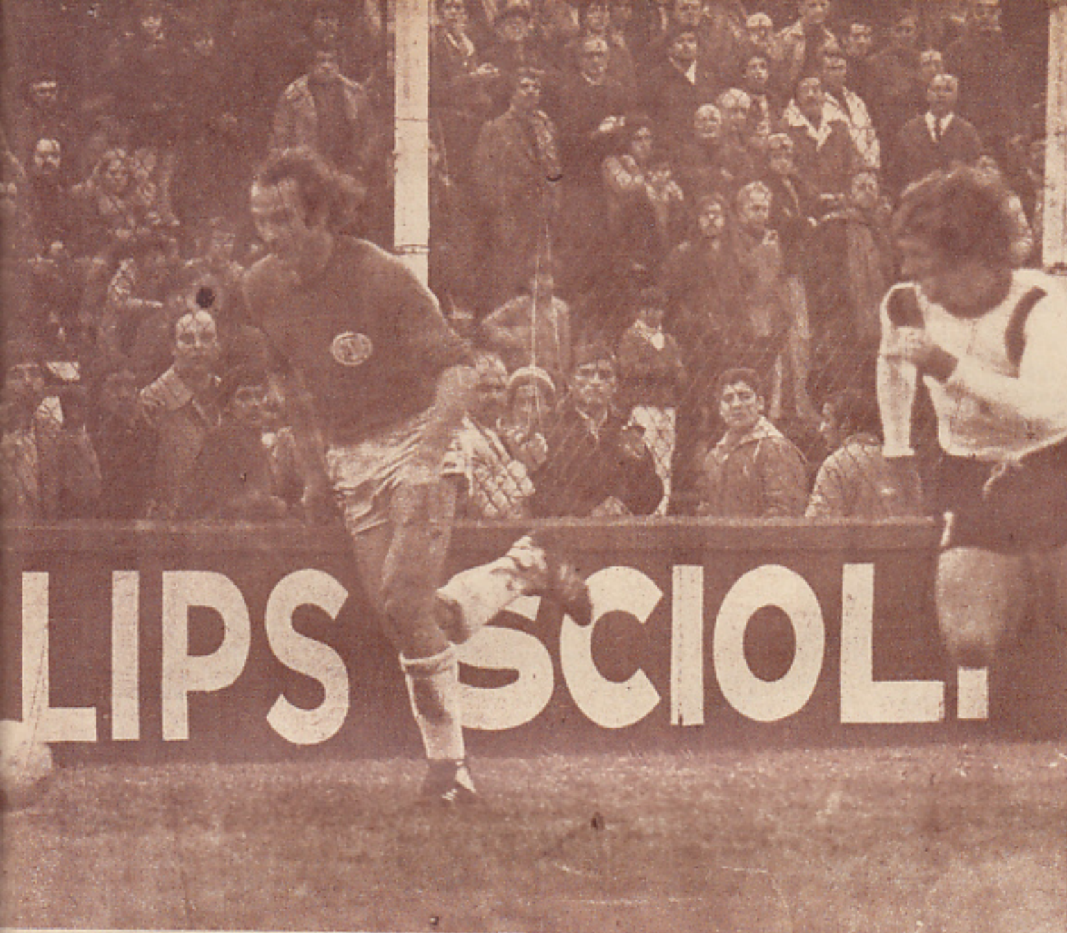
Scotta jugó preferentemente por izquierda. No tuvo mayor gravitación. En la escena tira afuera.