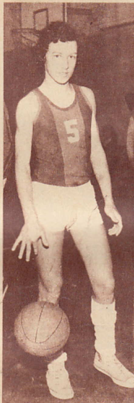
Prunes, una de las tantas promociones obligadas de San Lorenzo de Almagro.

Nos queda un sabor muy amargo en todo esto. San Lorenzo no puede ni debe seguir así. Todo esto no hace más que desprestigiar a nuestra grandiosa institución. Porque estamos de acuerdo en que la mayor culpa estuvo en la Federación, pero aceptemos también nuestras culpas, haciéndonos esta pregunta: ¿Cómo Morón, los jueces y los demás clubes sabían ese cambio de día 48 horas antes y nosotros no? Además, va siendo hora que dejemos de hundirnos y que empecemos con una recuperación real y definitiva.