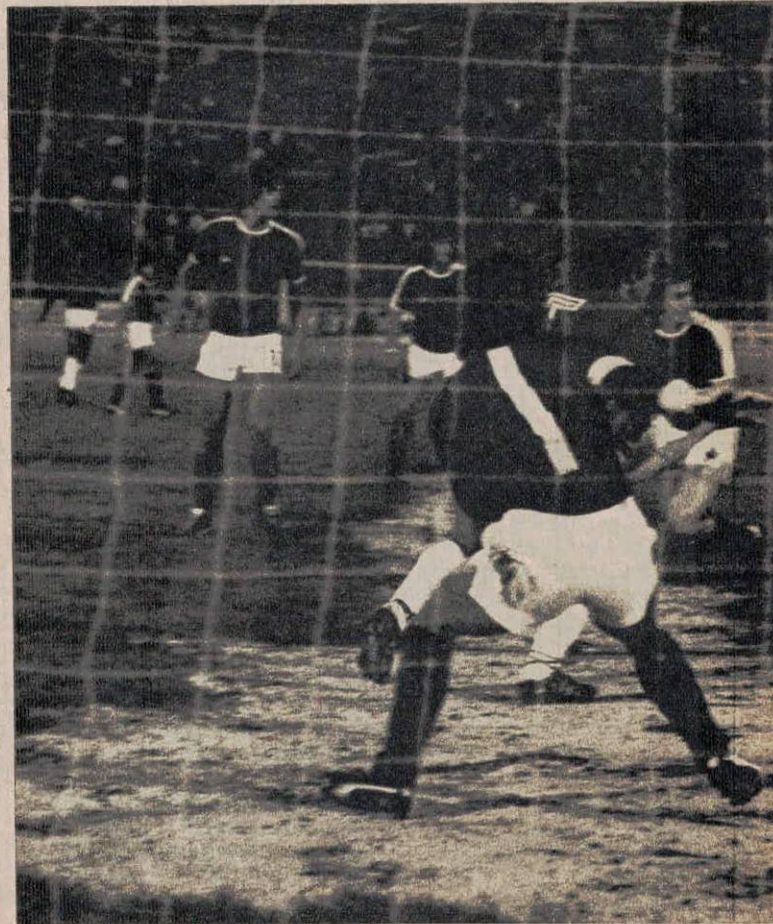
Furibundo remate de Coffone. Lo tapó el arquero cuando s