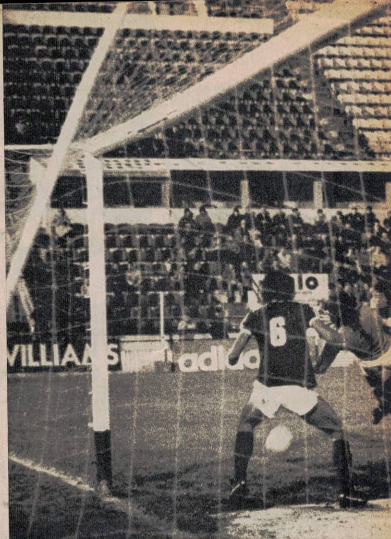
Entrada a fondo de dos de los nuestros. Se aprietan