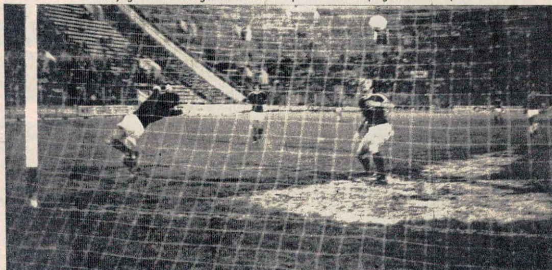
Insúa se había ido por la derecha. Metió el centro atrás. Alto.

gente. Esto no es el fin. Además, con esto lo único que fomentan es transmitir su locura al jugador, que empieza a sentirse mal anímicamente.