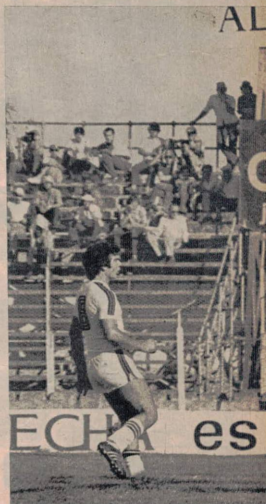
Borbollón en el area colonista. Ninguno de