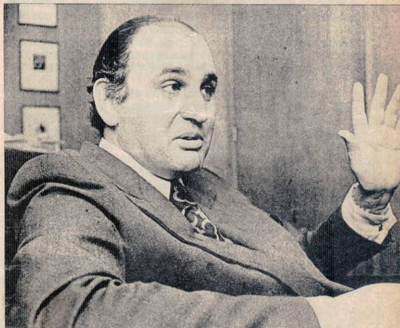
Hombre joven. Lúcido. Habló y no trató de convencer. Simplemente expresó con conceptos claros y que representan un modo de ser. Hizo San Lorenzo desde los 5 años. Tiene 37. Abogado.

—Así es. Por eso tienta, y más a aquéllos que están ávidos de ser conocidos. En un club no se trata de prestar dinero o avalar documentos con el prestigio que se pueda tener en el mercado, para figurar... Eso simplemente es fomentar la deuda del patrimonio de la institución y sumirla en el riesgo a desaparecer. San Lorenzo como institución debe perdurar al amparo de directivos dispuestos a trabajar de lleno en el