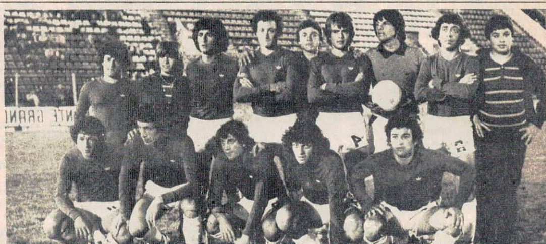
El equipo de San Lorenzo que fue abucheado al cabo del partido.

Héctor Veira: No puedo entender cómo se vuelve loca la