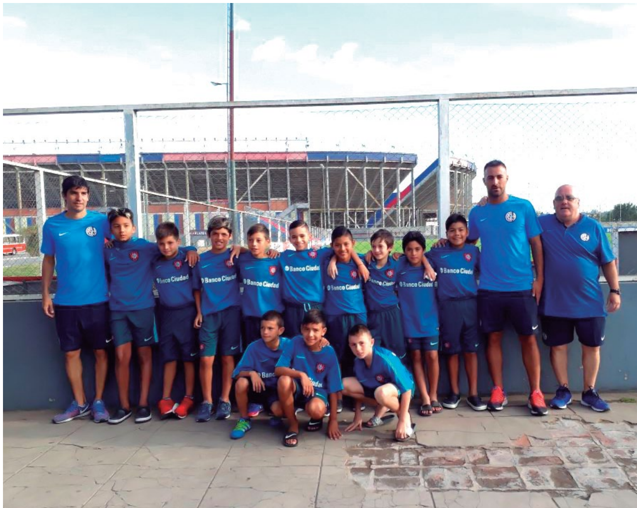
CUERVITOS Y CAMPEONES.