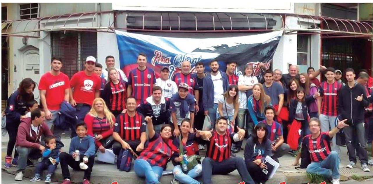
SIEMPRE JUNTO AL CICLÓN.