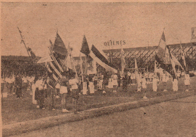
Las delegaciones participantes formada en el field.

C ON gran brillo y éxito de organización se efectuó el acto inaugural de la Olimpiada Infantil.