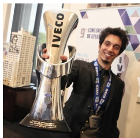
El trofeo de Iveco.