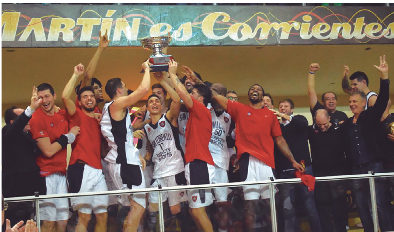
EL TRICAMPEÓN LEVANTA LA COPA.

S an Lorenzo volvió a festejar y se convirtió en el segundo equipo de la Liga Nacional en conquistar tres campeonatos consecutivos. Al igual que Peñarol en las temporadas 2009/10, 2010/11 y 2011/12, el conjunto azulgrana se adjudicó la competencia más importante del básquet argentino. ¿Seguirán llegando los títulos o comenzará la transición?