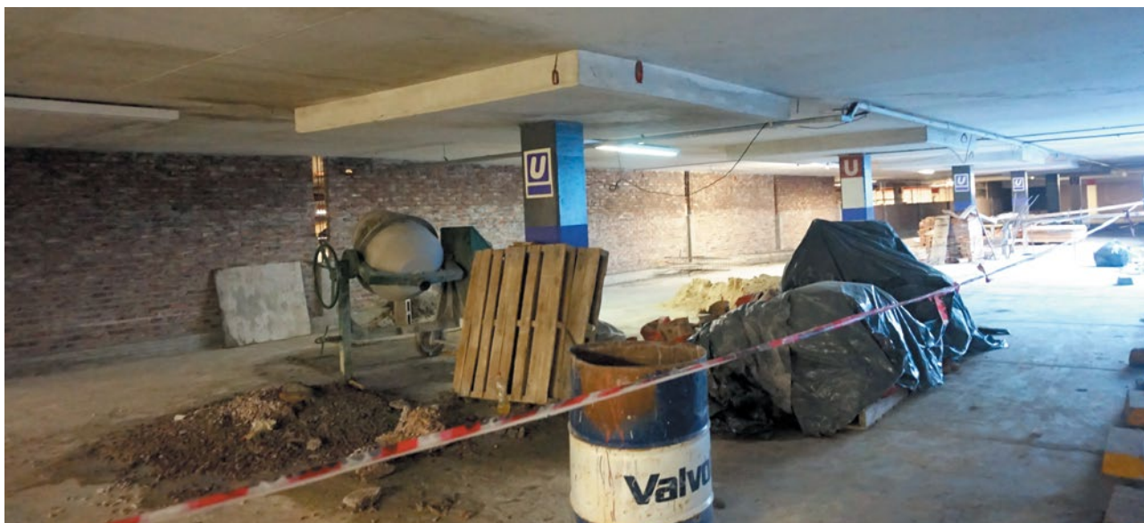
CONSTRUCCIÓN FINALIZADA DE LA PARED DIVISORIA DEL TERRENO DE AV. LA PLATA EN EL SUBSUELO DE COCHERAS

Lo que le resta al hincha de San Lorenzo es ser paciente y seguir soñando con el futuro estadio, porque como se van dando las cosas, cada vez falta menos para hacerlo realidad.