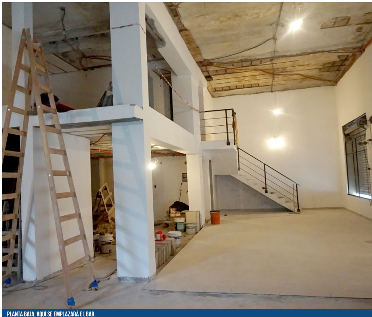
PLANTA BAJA, AQUÍ SE EMPLAZARÁ EL BAR.

Otro ladrillo más en Boedo que hace más firme la presencia de San Lorenzo en su barrio natal. La vuelta hace tiempo dejó de ser un sueño, ya es una realidad.