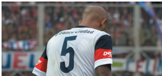
CON TRES TÍTULOS, EL "PICHI" ES UNO DE LOS MÁS QUERIDOS POR LA GENTE.