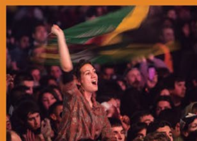
FESTIVAL DE REGGAE