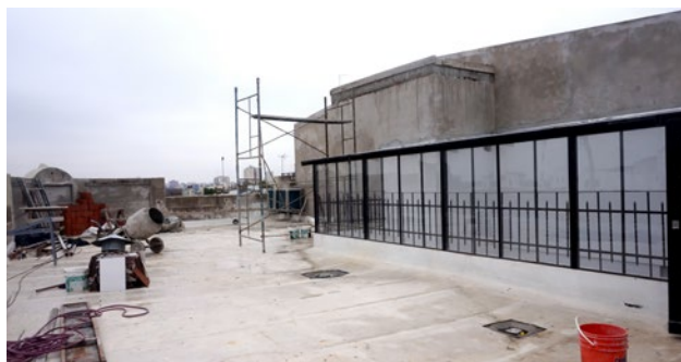
VISTA DE LOS TRABAJOS EN EL EXTERIOR DEL SEGUNDO PISO.

El Polideportivo “Roberto Pando” ya es una realidad y funciona a pleno. La construcción del futuro estadio, en el lugar que en poco tiempo desocupará el supermercado francés, también está encaminada, y ha comenzado a asomar otra de las obras que permitirá una mejor atención. Es que en la propiedad que se ubica en la intersección de las calles Las Casas y Av. La Plata, muy pronto, se trasladará el área administrativa que funciona en la Sede de Av. De Mayo. En la flamante y lujosa propiedad, que por cuestiones legales y ajenas a la institución tanto costó conseguir, funcionarán tres plantas: en planta baja se ubicará un bar amplio y confortable con sus correspondientes sanitarios, mientras que en el primer y el segundo piso estarán distribuidas las oficinas de contaduría, tesorería, rec. humanos, sistemas y un recinto exclusivo para reuniones de Comisión