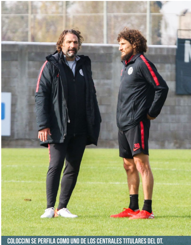
COLOCCINI SE PERfila COMO UNO DE LOS CENTRALES TITULARES DEL DT.

Con un esquema táctico similar al que utilizaba Almirón, el DT busca menos tenencia de pelota para apostar a un juego más directo, con presión bien alta y recuperación casi instantánea.