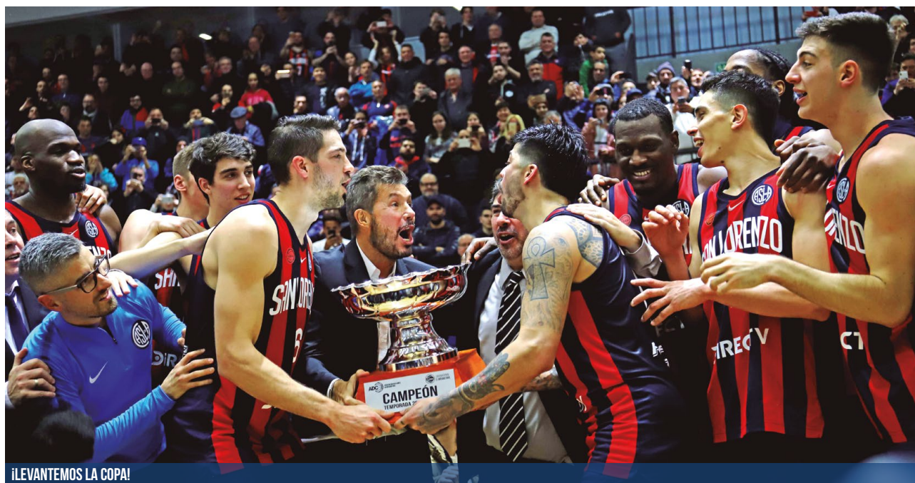
¡LEVANTEMOS LA COPA!

El básquet de San Lorenzo se metió en la historia de la LNB al ser el primer tetracampeón consecutivo, tiene las vitrinas repletas de trofeos y va por más: con nuevo DT y refuerzos, juega en septiembre un importante torneo internacional.