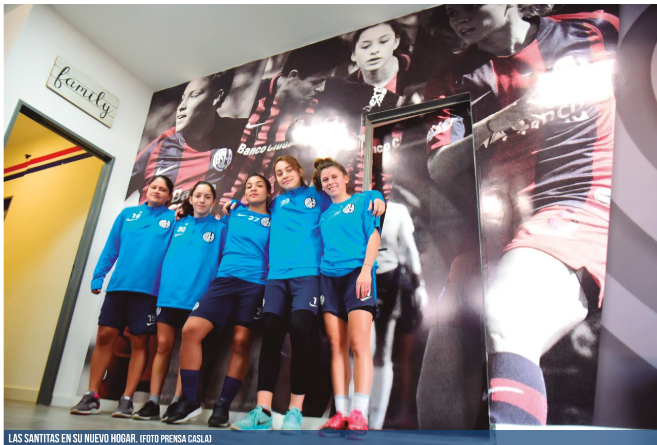
LAS SANTITAS EN SU NUEVO HOGAR.

San Lorenzo y sus deportes siguen creciendo: la buena nueva es que hace un par de semanas quedó inaugurada la nueva pensión de fútbol femenino en la Ciudad Deportiva. ¡Lujazo!