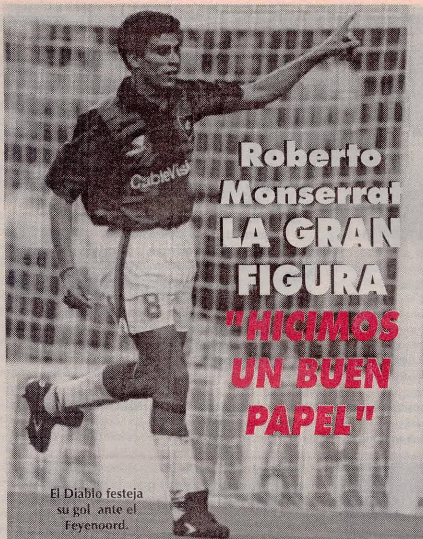
El Diablo festeja su gol ante el Feyenoord.