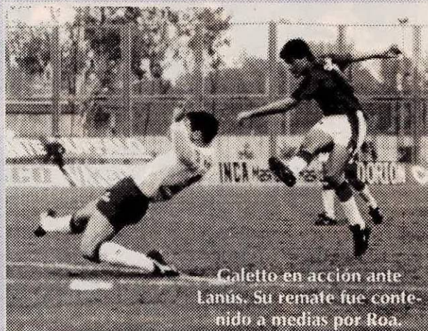
Galletto en acción ante Lanús. Su remate fue contenido a medias por Roa.

Nosotros seguimos con la esperanza en marcha. Iremos a Rosario a ganar y a esperar lo que suceda con Gimnasia. Tenemos que hacer lo imposible por ganar. Pasa que el ánimo baja un poco porque todos estábamos convencidos de que Ferro le saca-