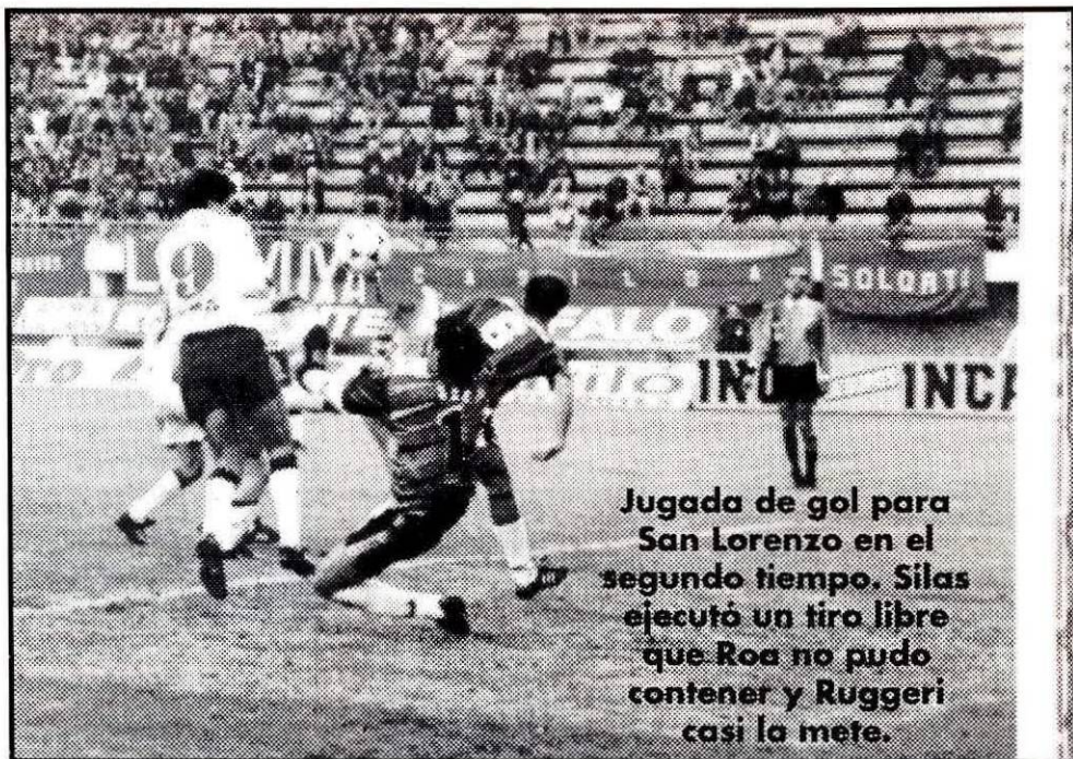
Jugada de gol para San Lorenzo en el segundo tiempo. Silas ejecutó un tiro libre que Roa no pudo contener y Ruggeri casi la mete.

El ánimo en la gente volvía a ser el mejor. Aunque no tuvo descanso ya que Gimnasia había comenzado a jugar la segunda etapa y ahora eran pocos los que querían estar al margen de lo que allí sucedía. Hasta que un minuto antes de que