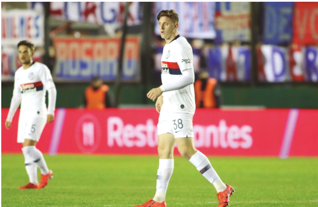
GAICH FUE CONVOCADO A LA SELECCIÓN MAYOR QUE DIRIGE LIONEL SCALONI.

A lo largo del tiempo, la Selección Argentina y San Lorenzo han tenido un vínculo con varias idas y vueltas. De un tiempo a esta parte, y gracias al gran trabajo que se viene realizando con los chicos del Ciclón, esta relación se ha ido fortaleciendo, tanto es así que desde el año 2017 a la fecha San Lorenzo y Boca son los equipos que mayor cantidad de jugadores entregaron a los seleccionados juveniles: 21 cada uno.