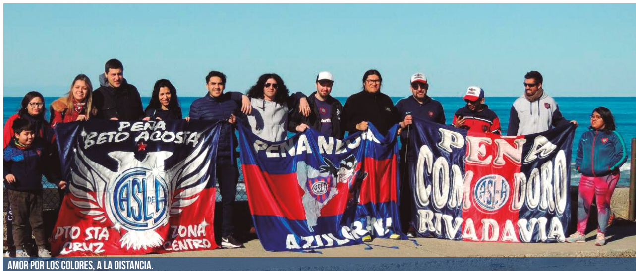
AMOR POR LOS COLORES, A LA DISTANCIA.