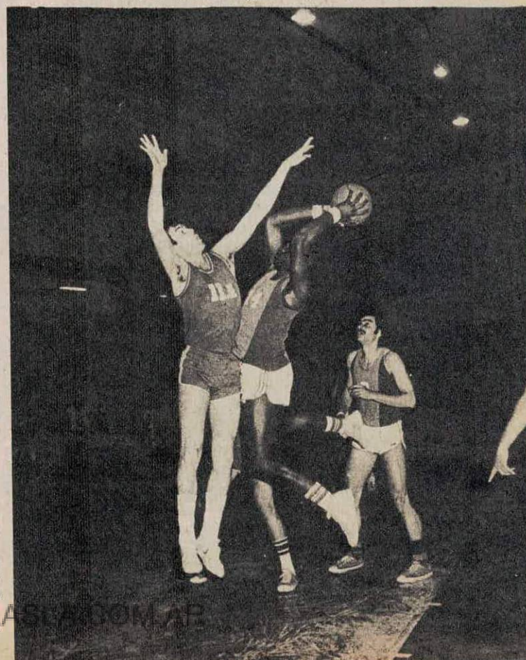
Hubert: Como siempre fue el que más convirtió. Ante San Andrés convirtió 21. Frente a San Miguel concretó 39 tantos. Bárbaro.