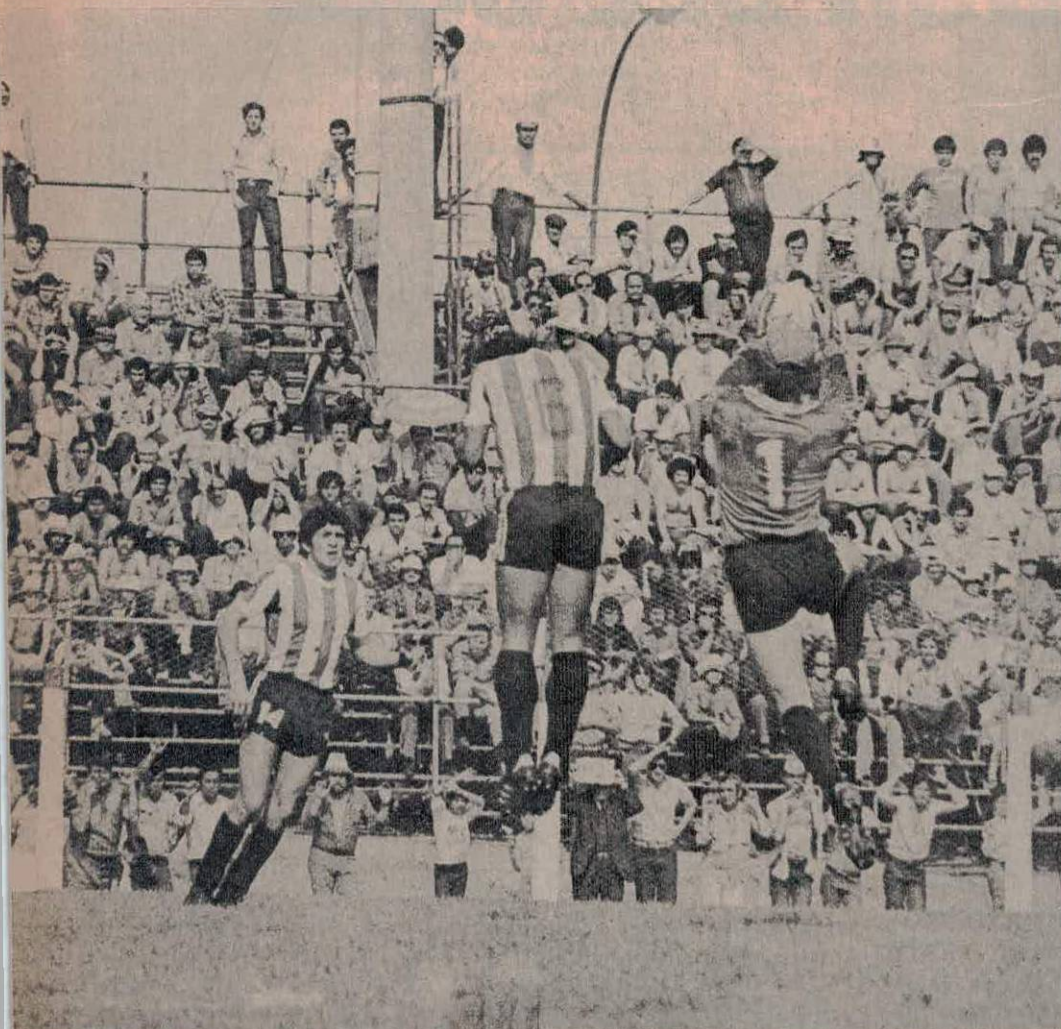
en el salto Nieto. El bloque defensivo cordobés de alto fue imparable. Lastima.

San Lorenzo se metió en la teoría de "sacar" un punto. Era más fácil no jugarse, no arriesgar. Pero cuando pareció que todo se daba, Instituto encontró el agujero y nos dejó con la buena intención. El árbitro, Alberto Ducatelli, también colaboró eficazmente en ello comiéndose dos claros penales. La ausencia de Pena, por nuestro lado, y la actuación excepcional de Chaparro, por la otra parte, también tuvieron gran influencia en el resultado.