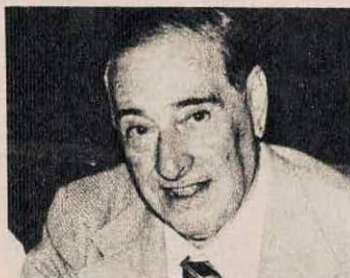
Lastreto suele ir a las reuniones. Pero como él hay muy pocos dirigentes.

más que para ir a buscar la entrada que les permita el acceso a platea. De ahí en más están borrados.