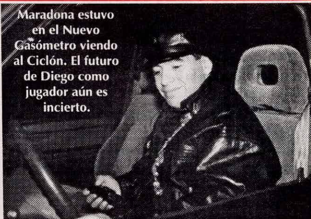
Maradona estuvo en el Nuevo Gasómetro viendo al Ciclón. El futuro de Diego como jugador aún es incierto.