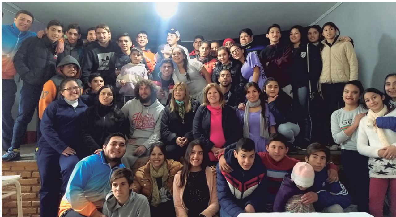
EL DEFENSOR AZULGRANA FUE RECIBIDO CON MUCHO CARÍÑO.